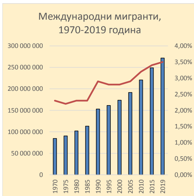
Фигура 1 - Ръст на международните мигранти за периода от 1970 до 2020 г

От публикуваните данни [7] на сайта на ООН е видно, че през 2019 г., повечето международни мигранти (около 74%) са в трудоспособна възраст (от 20 до 64 години), с незначителен спад на възрастовата граница на мигрантите, а именно ди от 20 години, от 2000 г. до 2019 година